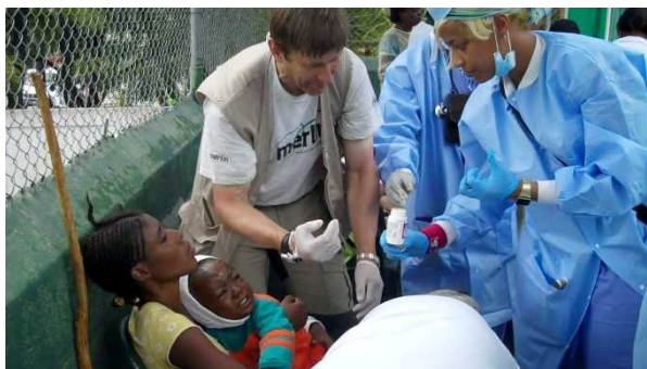
Rodina, které se dostává tolik potřebné zdravotní péče

Bez pokračující finanční podpory našich soucitných dárců by dodávky humanitární pomoci a životadárné záchranářské akce nemohly pokračovat.