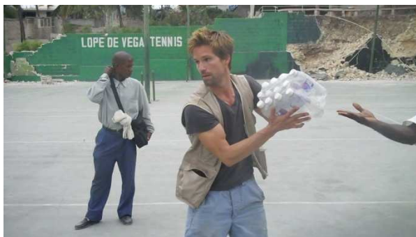
Vykládání dodávky čisté vody a potravin