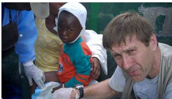
Lékařský tábor - pomoc zraněným rodinám